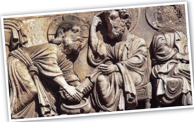
'Jezus wast de voeten van Petrus' (12e eeuw)