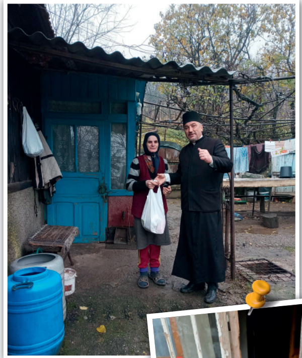
Geven van het voedselpakket in Cozia door de priester / Voedselpakket in Costuleni