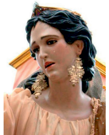
Claudia Procula, vrouw van Pilatus, kleindochter van keizer Augustus

Natuurlijk komen Maria en Maria Magdalena aan de orde en ook een klassieker uit de 40dagentijd: de vrouw die Jezus voeten zalfde. Ik wil echter ook eens onderzoeken wie de slavin was die Petrus verried, vlak voordat hij op zijn beurt Jezus zou verraden. En wat bewoog de vrouw van Pilatus om haar man op het hart te drukken Jezus niet te veroordelen? Kortom: de komende weken staan volledig in het teken van de passieweek en de verhalencyclus die bij die periode hoort. Ik hoop dat we op deze manier extra bewust worden van de kern van ons kerk-zijn. En dat is, mijns inziens, leven in navolging van Jezus. Ons spiegelen aan zijn geloofsvertrouwen, zijn zoeken naar verzoening en zijn liefdevolle houding naar de mensen op ons levenspad. Op naar Pasen!