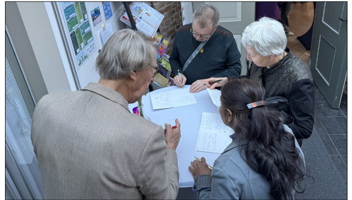
Er gingen maar liefst vier kaarten met groeten de deur uit

Het ging over de vrouw die Jezus met dure olie zalfde. Onze predikant tekende haar als iemand die moed had om voor liefde te kiezen, ongeacht wat anderen daarvan zouden zeggen. Zo verspreidde zij de geur van vrijheid.