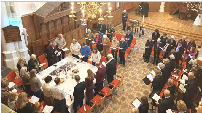
Witte Donderdag 2023 (archieffoto)