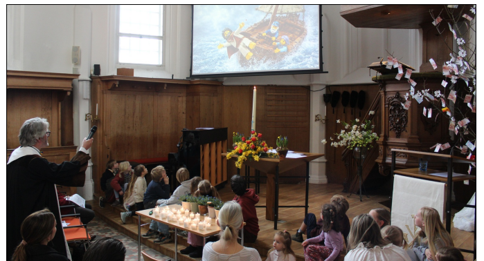
Er waren een heleboel kinderen die van onze predikant het Paasverhaal over Jona verteld kregen in woord en beeld.