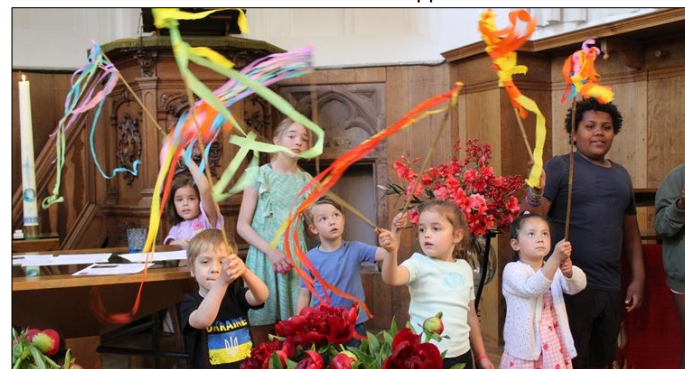
Ook de kinderen lieten het vuur boven hun hoofden dansen.