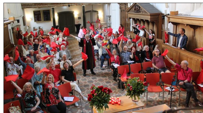
Het Pinkstervuur wapperde boven onze hoofden