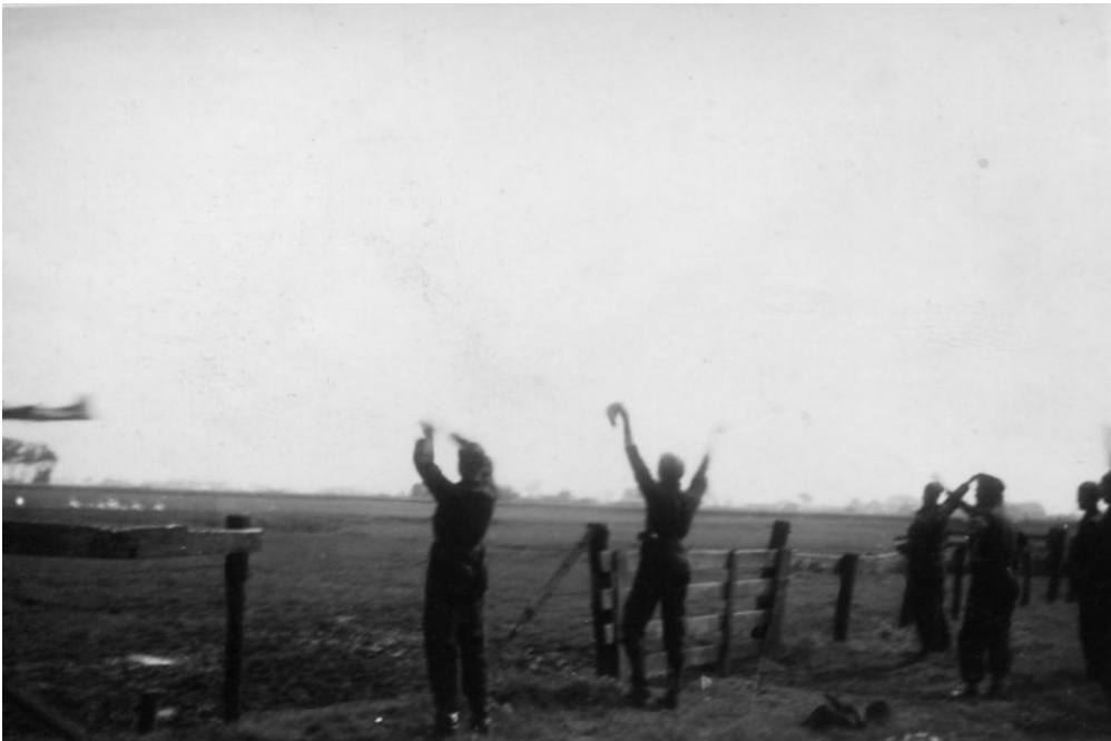
Voedseldropping bij vliegveld Bergen, Collectie "Beeldbank HVB/collectie Gré Schouten-Dapper

80 jaar na de bevrijding gaat de Historische Vereniging Bergen, deze dropping herdenken door een dropping te laten plaatsvinden tijdens het bevrijdingsfeest op 5 mei. Er vliegen twee of drie vliegtuigen, van Royal Air Force Association squadron Edambusters, om 13.00 uur over het terrein van de Ruïnekerk die symbolisch kleine broodjes, van bakkerij Fermento uit Alkmaar, zullen droppen. Het wordt een bijzonder eerbetoon aan de geallieerden die zorgden voor de voedseldropping toentertijd. Met heel veel dank aan het RAFA, squadron Edambusters.